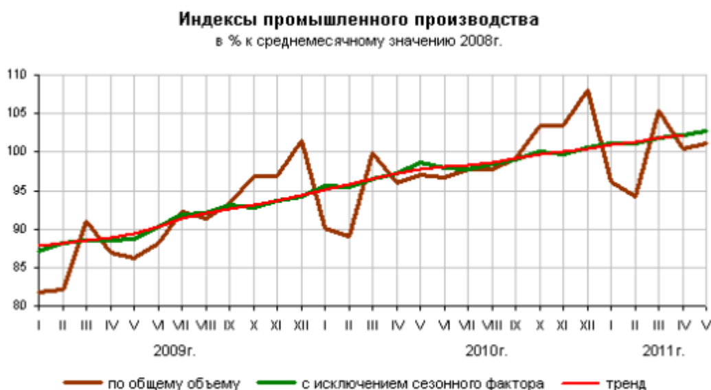
Рис.1 Индекс промышленного производства

Стоит, что снижение темпов прироста выпуска промышленной продукции наблюдается во всех ключевых компонентах сводного индекса промышленного производства (ИПП): в добычи полезных ископаемых прирост снизился с 6% до 2,7%, в обрабатывающих отраслях с 14,4 до 8,1%, а в производстве и распределении электроэнергии, газа и воды прирост в 6,0% и вовсе сменился едва заметным увеличением на 0,1%.